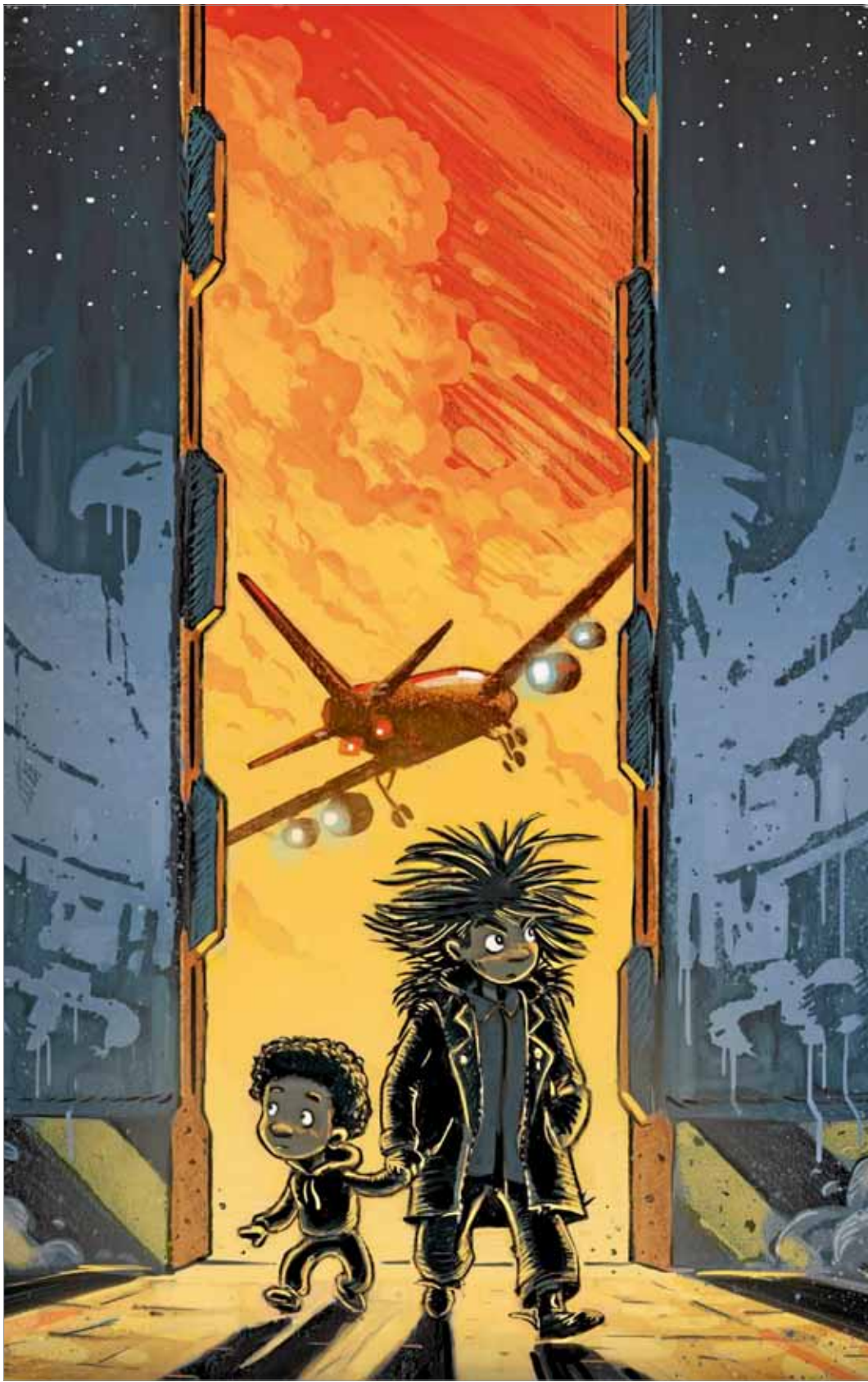
Pasi Pitkänen on kuvittanut Timo Parvelan ja Björn Sortlandin kirjasarjan tieteiselokuvien maisemiin.

Oikeaa tiedettäkin sovitetaan mukaan: Kepler-62 on Lyyrän tähdistön tähti, jonka ympäriltä Kepler -luotain on löytänyt planeettakiertolaisia. Kuusiosaisen kirjasarjan kaksi ensimmäistä osaa ilmestyvät tänä syksynä, ja loput tulevat puolen välein. Loppuhuipennukseen päästään syksyllä 2017. RISTO LÖF